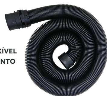
MANGUEIRA SUPER FLEXÍVEL ALCANÇA O COMPRIMENTO DE ATÉ 3,8 METROS